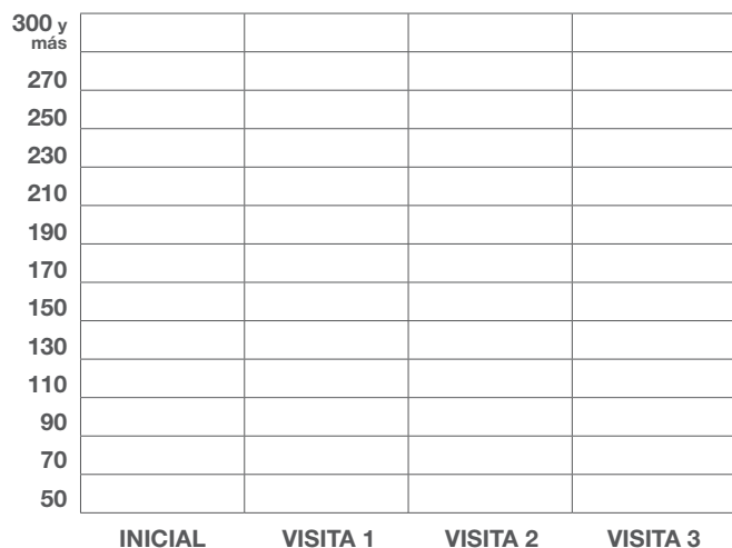
COLESTEROL LDL (MALO O C-LDL)

Mi nivel recomendado de colesterol LDL (malo) es: _____